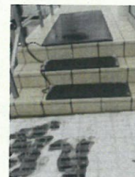
(出入口のヒートマップ)

塩化カルシウムの特徴は、凝固点を-50度程度まで引き下げることができるということです。ここまで下がると、どのような極寒の地でも一度に多くの雪を解かすことができます。また、塩化カルシウムの融雪効果は、数分から十数分程度で現れます。即効性があるため、雪が積もった道に撒くのに適しています。