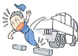
荷役作業安全対策(事業者用)