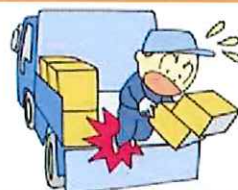
荷役作業重大災害対策